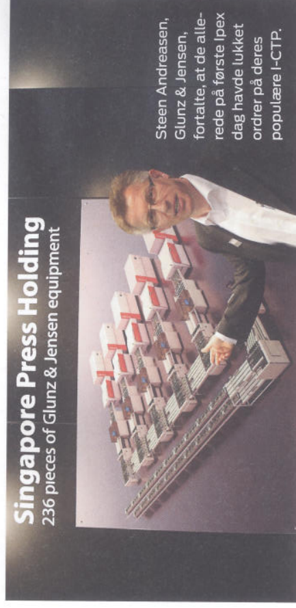
Singapore Press Holding 236 pieces of Glunz & Jensen equipment