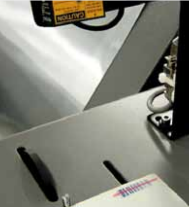
Selección de placas, apilado, ordenado y rastreo de placas

Hoy en día los periódicos tienen más páginas, secciones y color. A menudo imprimen otros productos y muchos rollos de múltiples líneas de prensa. Así, en cuanto a la paginación y la colocación de placas, el tener la placa correcta en el lugar adecuado no debiera tener a una persona seleccionando y apilando placas escribiendo sobre el reverso de éstas la identificación de las páginas y su destino en la prensa – información que puede mejor almacenarse en un código de barras.